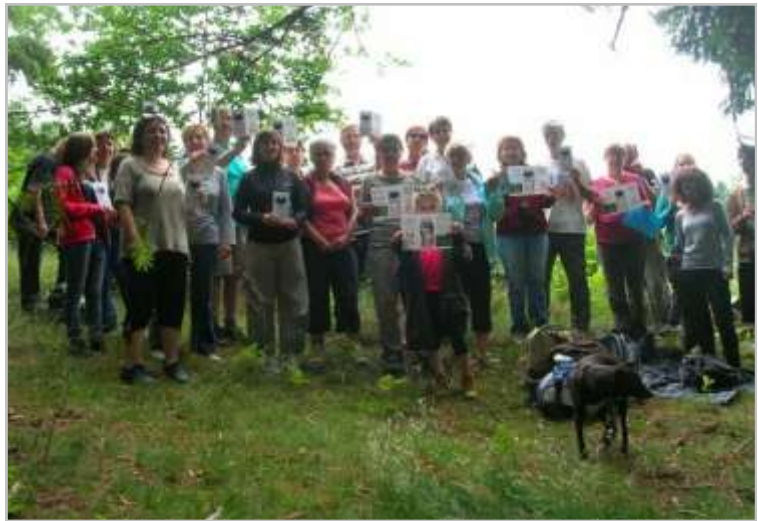
Randonnée organisée à la Rochetaillée (42)