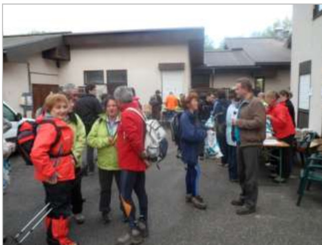
Prévention lors de la Grimpée du Laudon (74), 2012

L'ensemble des actions de prévention réalisées par l'association en 2011 ont obtenu le label « Année internationale de la forêt 2011 ».