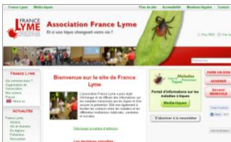
Page d'accueil du site www.francelyme.fr